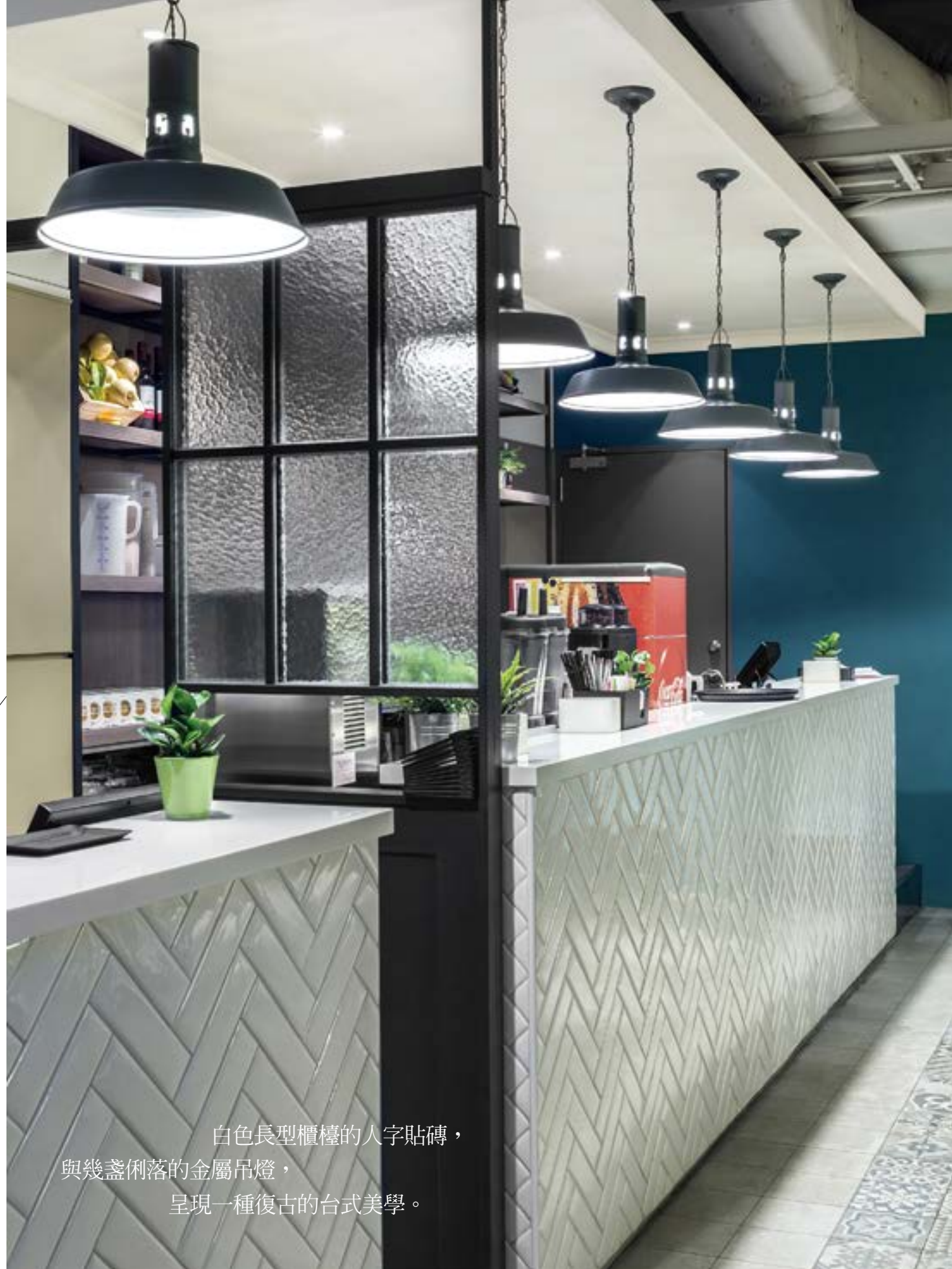
白色長型櫃檯的人字貼磚， 與幾盞俐落的金屬吊燈， 呈現一種復古的台式美學。